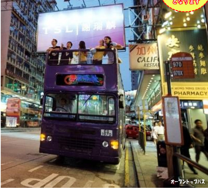
オープントップバス